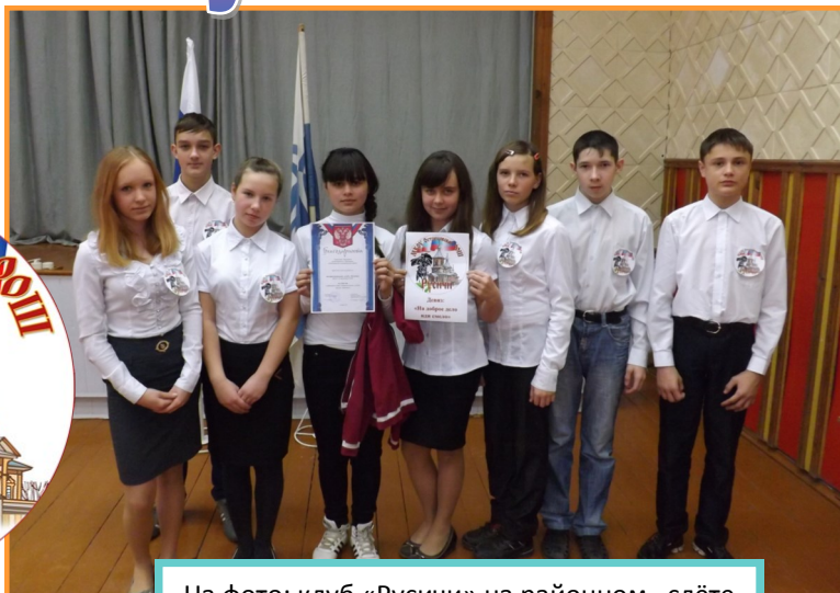
На фото: клуб «Русичи» на районном слёте патриотических клубов «Будем знакомы!»