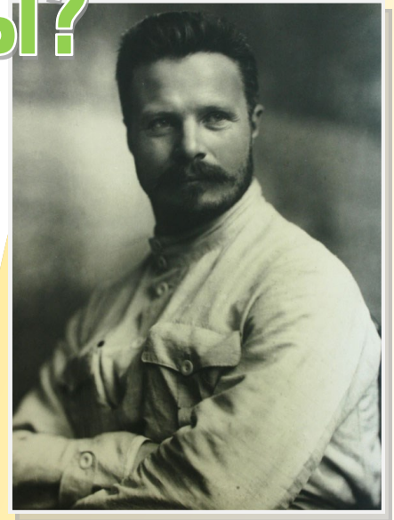
Михаил Васильевич Фрунзе

воротом и червленом (красном) сарафане, вверху украшенном золотом, с червленым кокошником, украшенным золотом, и серебряным платком на голове, сидящая и обращенная вправо, из-за её колен возникает стоящая за нею золотая гребенка прялки с серебряной куделью, которую она держит правой рукой, перед ней стоит прялка, колесо которой она вращает левой рукой.