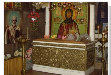
Мощи святой Анимаисы в храме Александра Невского в городе Родники