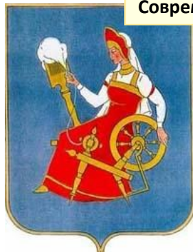
Современный герб Иванова

Утверждён Ивановской городской Думой первого созыва 22 мая 1996 года.