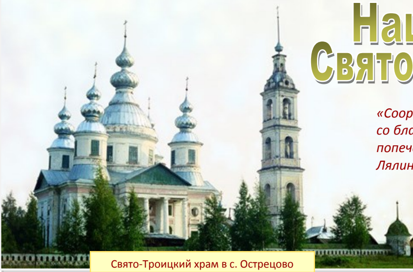
Свято-Троицкий храм в с. Острецово