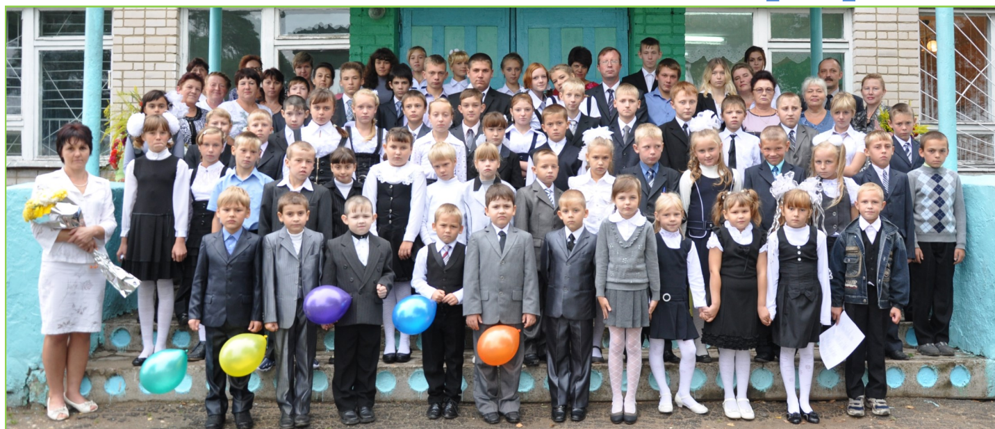
Общешкольное фото. 2 сентября 2013 года