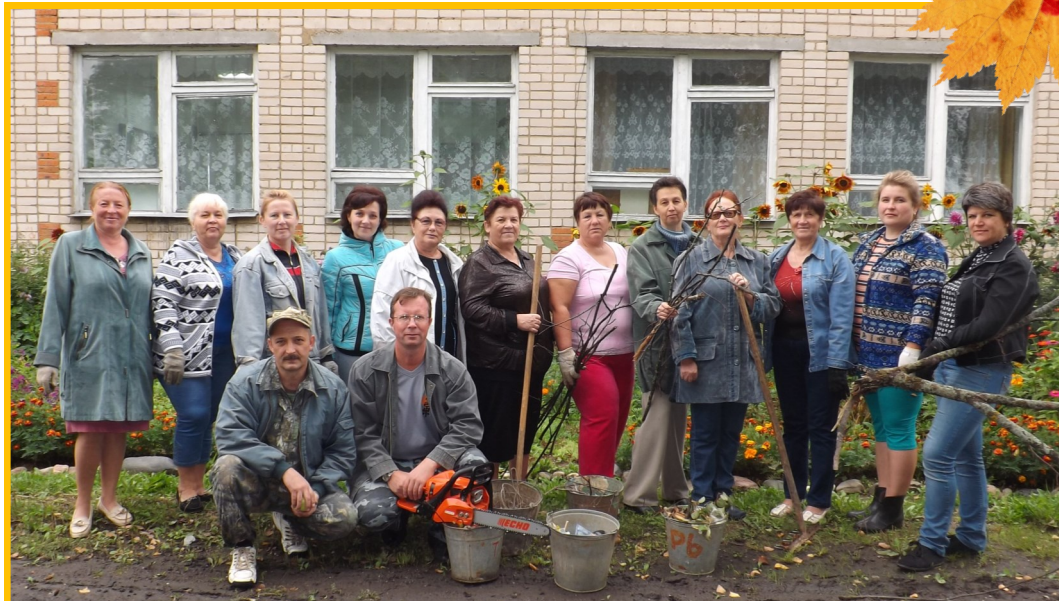
Всем коллективом на субботник!

Обновленная, красивая школа совсем скоро распахнет свои двери, приветливо встречая ребят и педагогов трелью первого звонка.