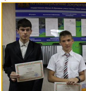
На фото: Победители конкурса «37.RU»