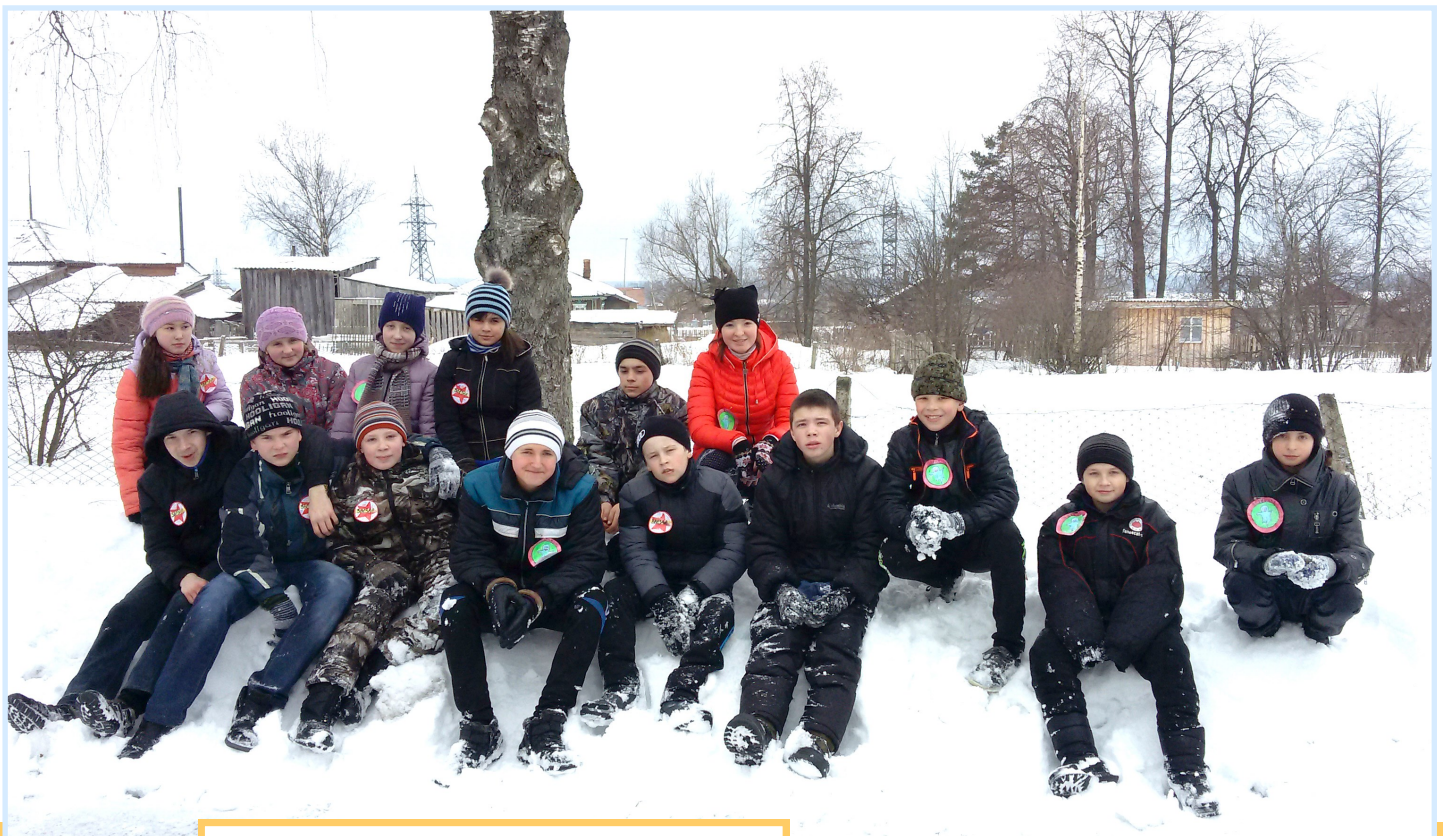
На фото: Уставшие, но весёлые участники игры