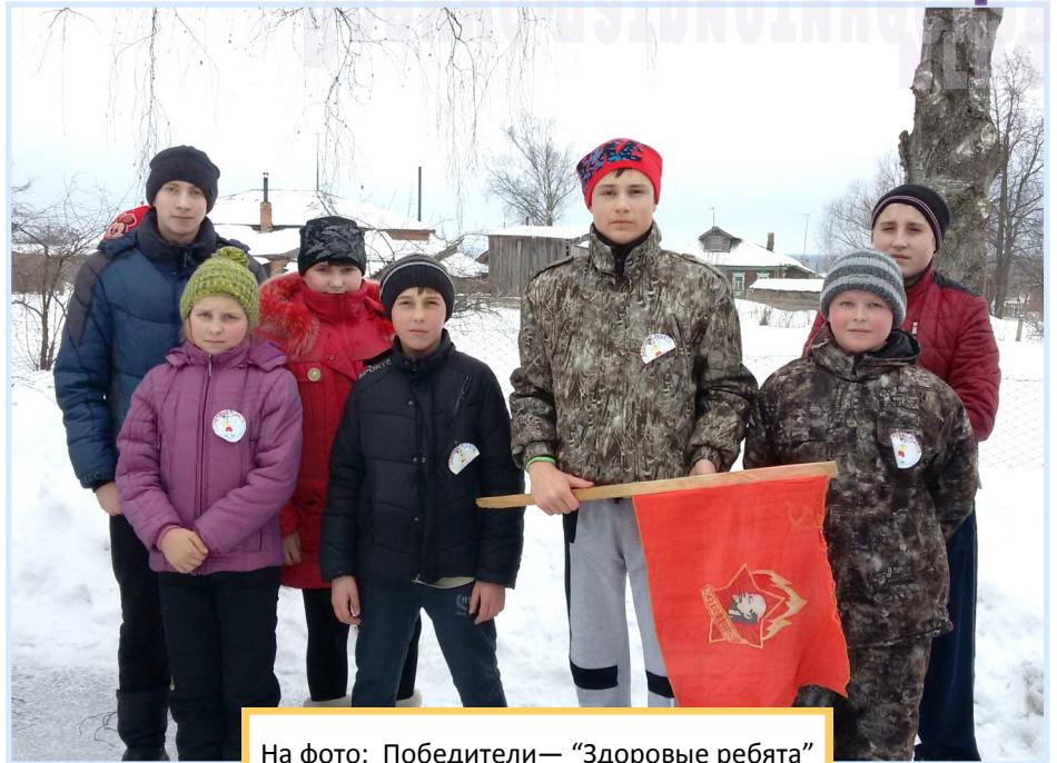
На фото: Победители— «Здоровые ребята»

Благодарим учителя физической культуры Высоцкого В.М. за подготовленное мероприятие!